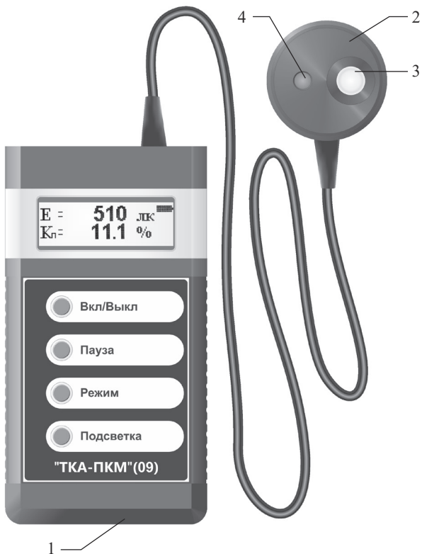
Рис.1 – Внешний вид прибора “ТКА-ПКМ”(09)